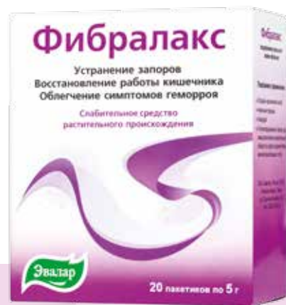
Оболочки семян подорожника